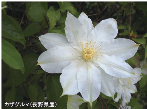
カザグルマ(長野県産)