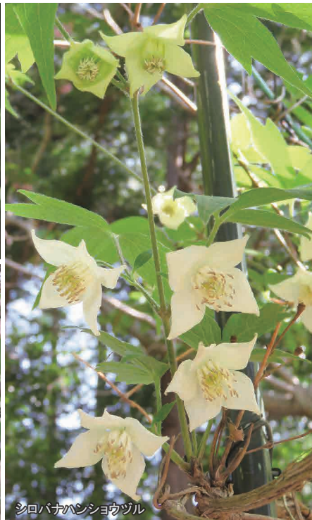
シロバナハンショウヅル