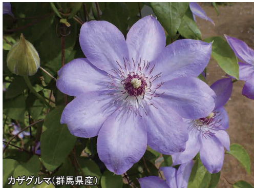
カザグルマ(群馬県産)

「クレマチス」(キンポウゲ科センニンソウ属)には、約300の野生種と数千にもおよぶ園芸品種が存在します。その花は色や形が変化に富み、よい香りのする種類もあるなど、とても多様化しています。本公開では、日本のクレマチスであるカザグルマをはじめとする野生種や、それらをもとに作出された数多くの園芸品種の花々を通じて、自然とヒトが生み出した植物の多様性に触れていただきます。早咲きから遅咲きまで多彩な花々のリレーが楽しめます。本年度は当園で展示している、さまざまな日本の野生のクレマチスについてもご紹介します。