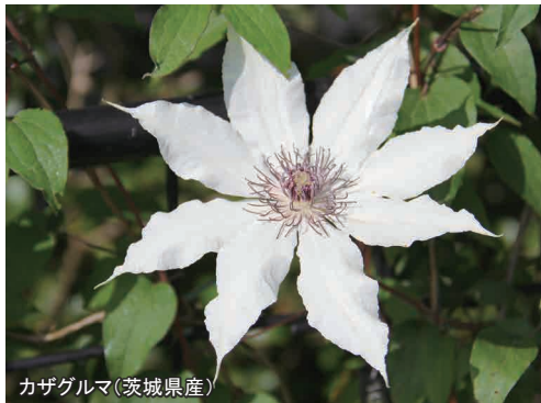
カザグルマ(茨城県産)