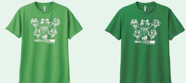
ブライトグリーン