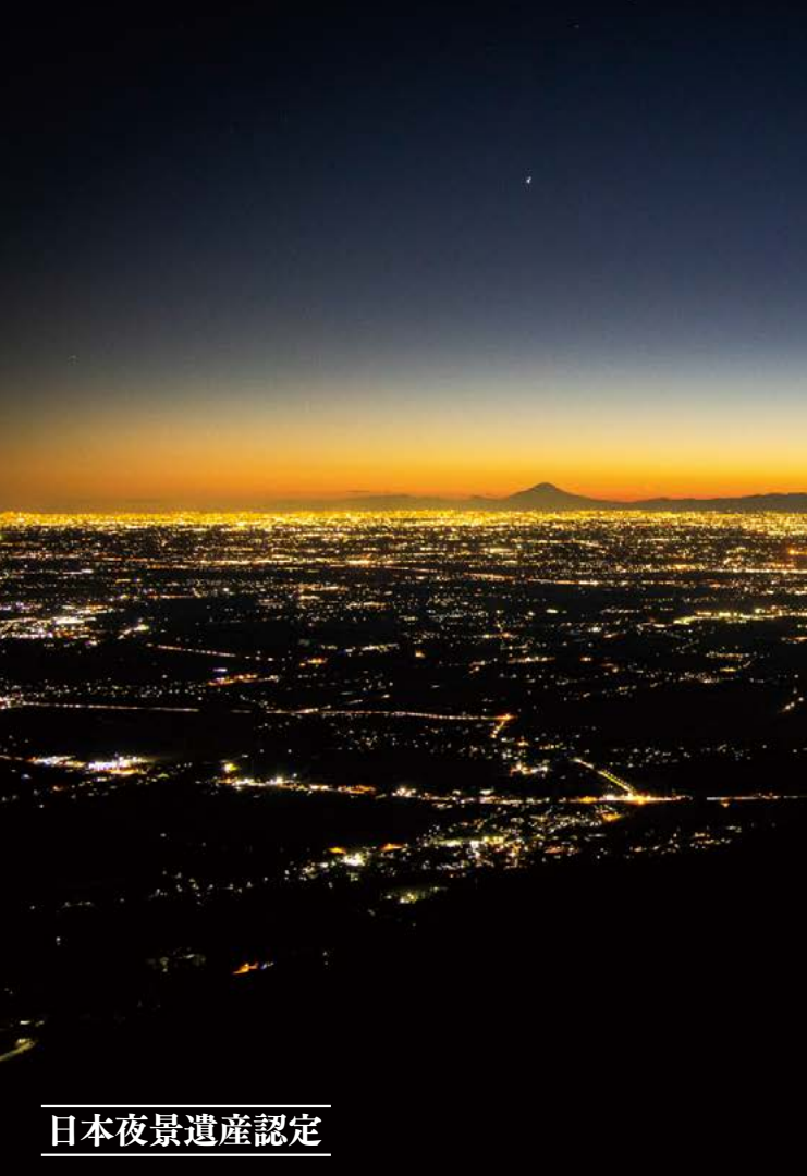
日本夜景遺産認定